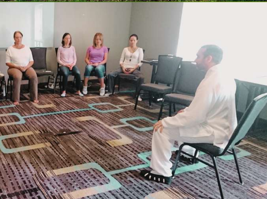
Práctica grupal guiada

Viajamos en el 2016 hacia Miami, Estados Unidos.