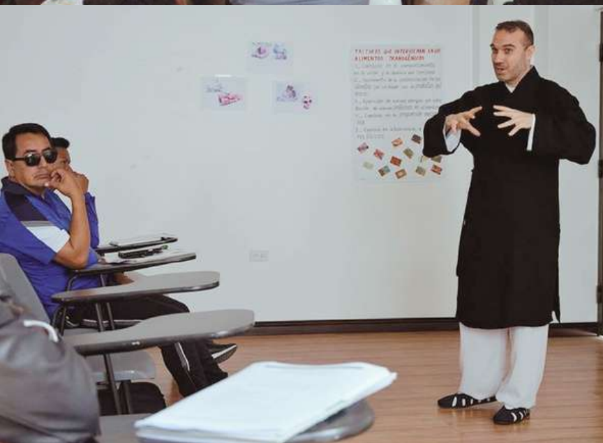
Jornada de Qigong Terapéutico