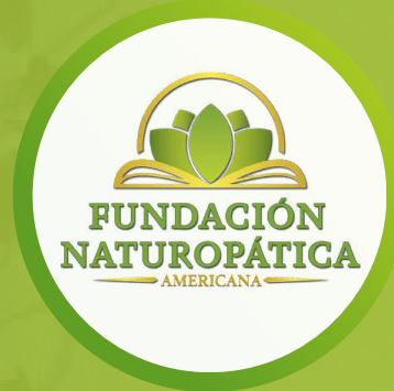
Evento sobre Naturopatía