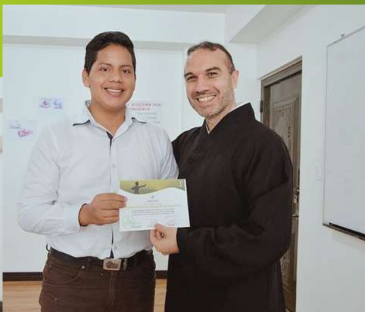
Entrega de certificados del taller