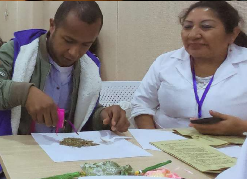
Práctica de Herboristería