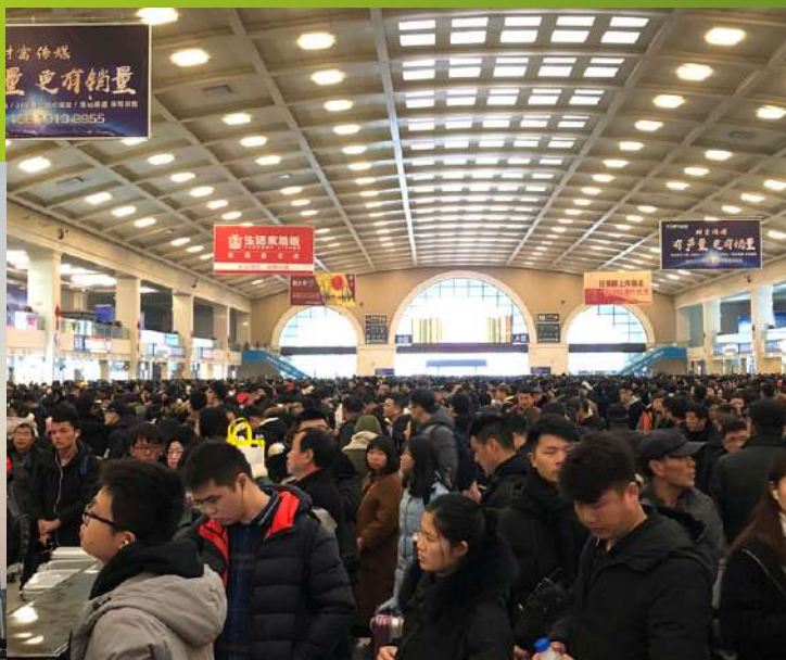
Estación de tren