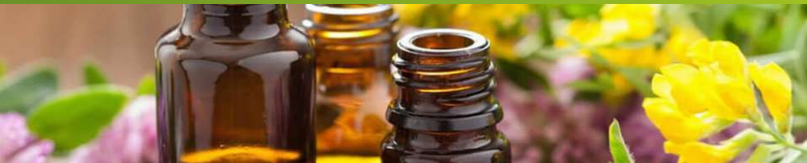
Flores de Bach