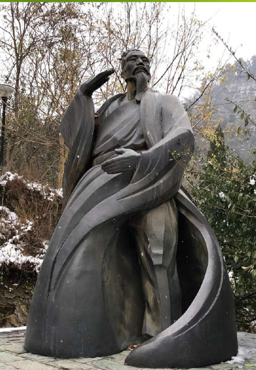
Zhang Sang Feng, creador del Tai Chi

Visitamos los Montes Wudang durante el invierno del 2018.