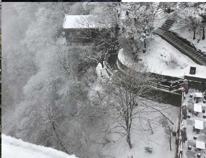
Vista del Monte nevado