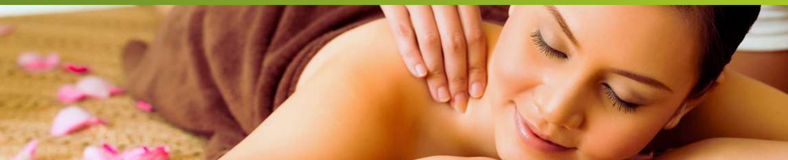
Masaje Oriental Tuina