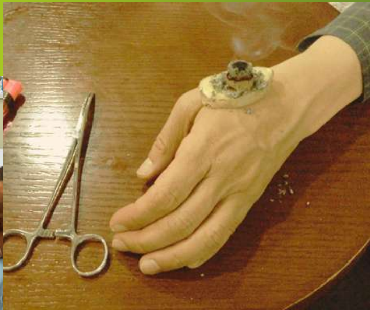
Práctica de Moxa con Jengibre