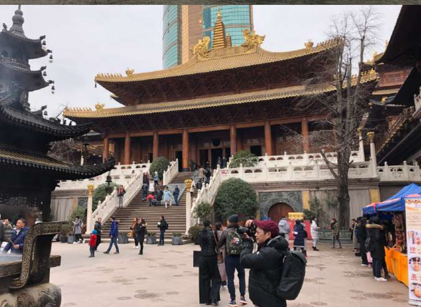
Templo Jing'an, Templo Budista