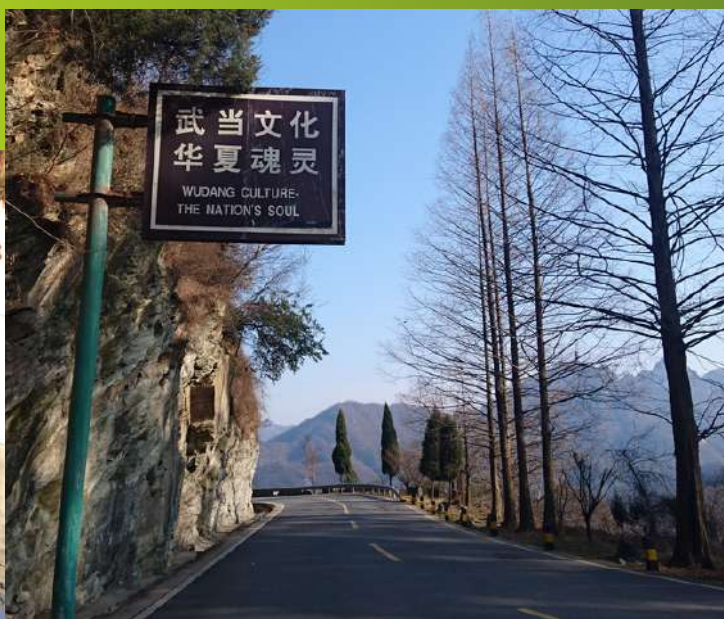
Ruta a las montañas